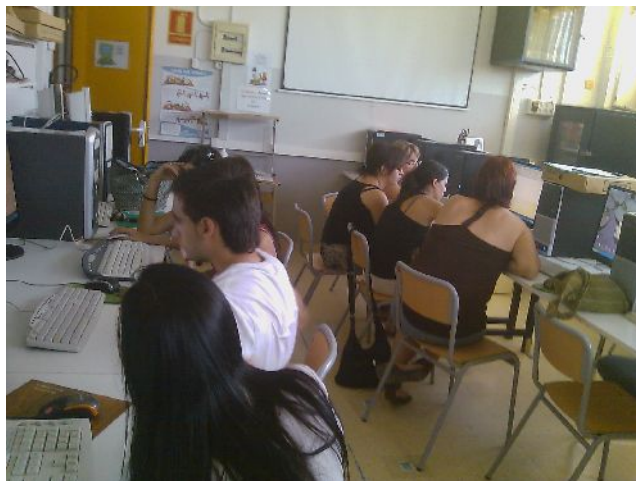
CURS TIC AMPOSTA