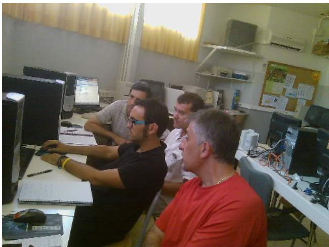
CURS TIC AMPOSTA

http://usuaris.tinet.cat/mrpte/llaut.htm