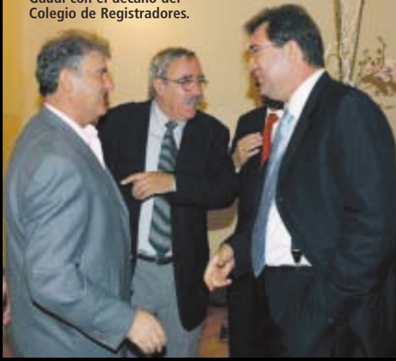
EL PRESIDENTE del Instituto Gaudí con el decano del Colegio de Registradores.