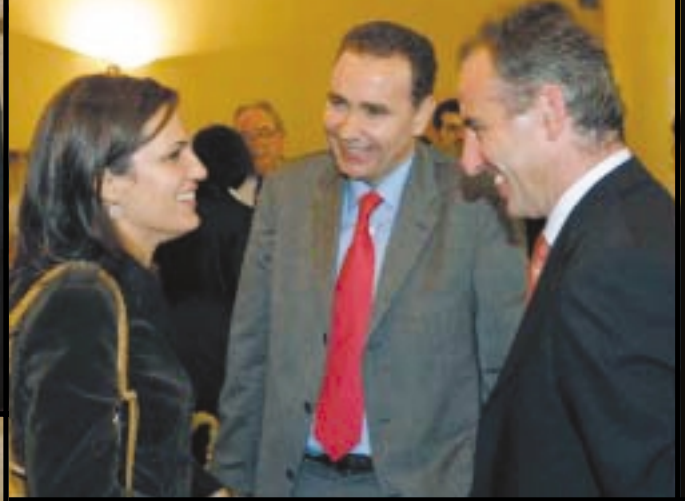
LA DIRECTORA GENERAL con miembros de la Junta de Gobierno.