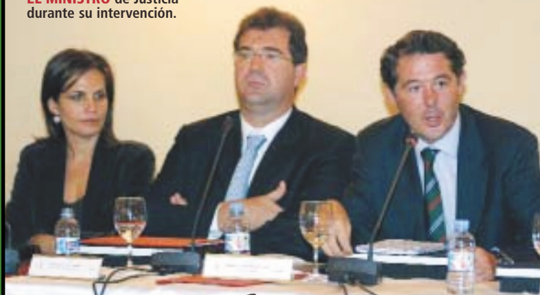
EL MINISTRO de Justicia durante su intervención.